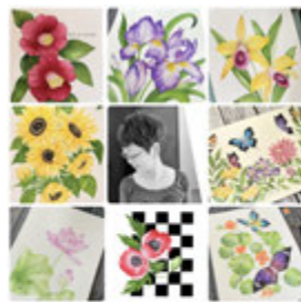
君野倫子 水彩画展 HEALED BY FLOWERS ～花に癒されて水彩の彩り～