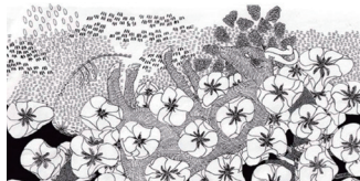
坂本裕子イラスト報告室

「わたしは創作する時、家系や時代といった脈々と続いてきた大きな流れを意識しています。