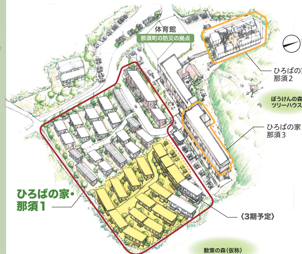
ひろばの家・那須1