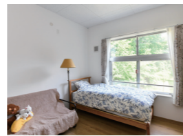
採光、風の通りも良好 クローゼット、収納も充実

多世代の暮らしを応援する家です。「那須まちづくり広場」を「歩いて暮らせる小さな拠点」として、新しいコミュニティを創造したい方、子育て世帯の方、那須町に移住する方におすすめです。