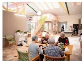
屋内プールのため、天井が高く明るく広々とした住宅

プールを改修した天井の高い明るい室内。機械浴を採用せず、ヒノキ風呂とユニットバスをご利用いただけます。要介護1以上の方が暮らし、看取りまで対応する全26室です。