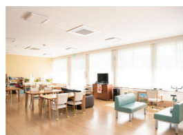
南向きの大きな窓。元教室2つ分の廊下を取り込んだ大空間

190㎡の広さ、18名定員です。自由な時を過ごしていただいています。こちらにも機械浴を採用せず、ヒノキのお風呂でゆっくり入れるのが人気です。