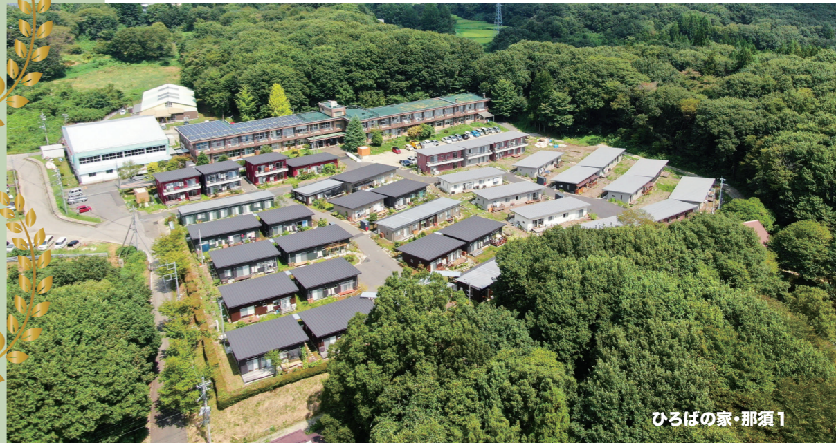
ひろばの家・那須1